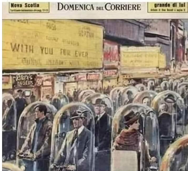
Dibujo de Wálter Molino en 1962, titulado "La Vida en 2022"