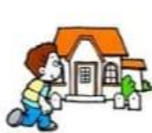
get back home