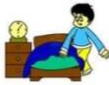
go to bed