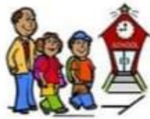
go to school