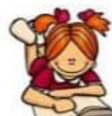
read a book