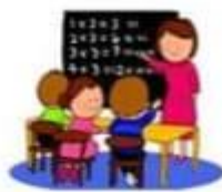
learn at school