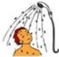
have a shower