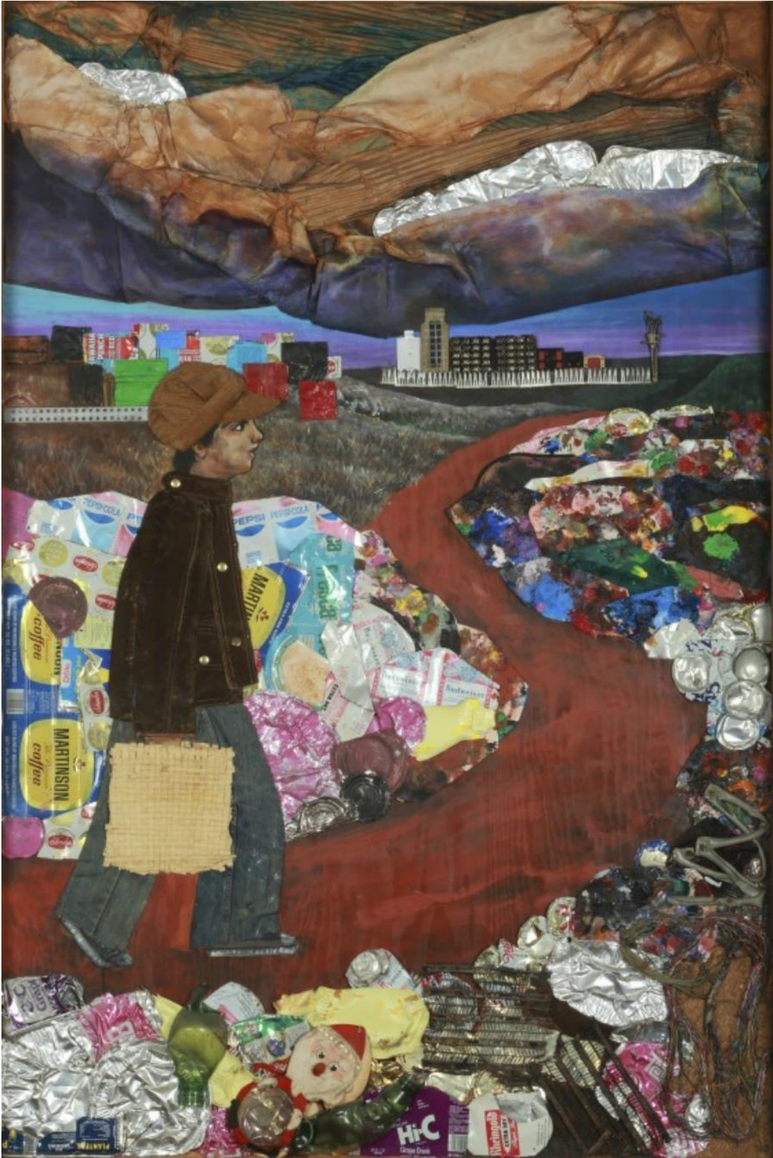
“Juanito llevándole la comida a su padre”.