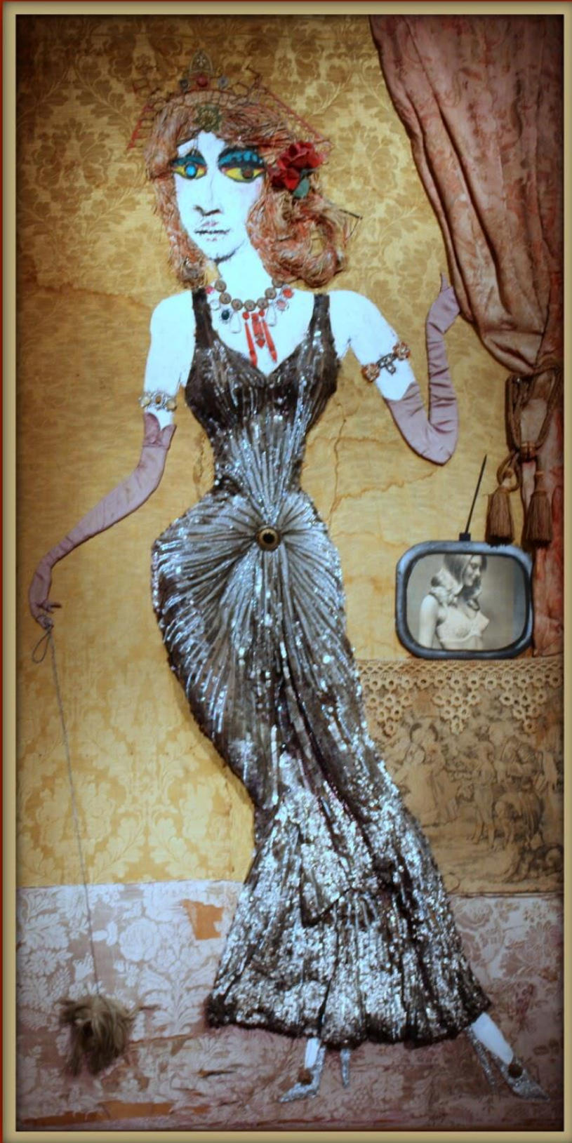
"La Apoteosis de Ramona"