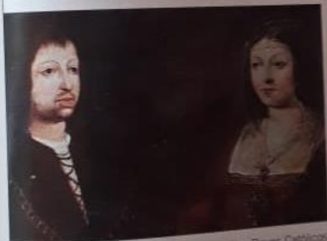
Los Reyes Católicos

En 1498, Vasco da Gama consiguió atravesar el océano Índico y llegar a Calicut, en la India. Portugal controló de allí en más las costas africanas y monopolizó el comercio ultramarino con Oriente.