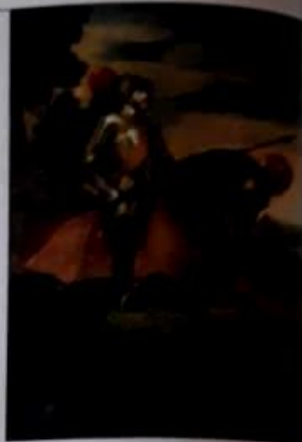
Carlos V, emperador de Alemania y rey de España, gobernó entre 1516 y 1556.

A partir de entonces, en la mayor parte de los reinos europeos la monarquía pasó a ser hereditaria. Al mismo tiempo, se difundió la idea de que su legitimidad residía en la delegación del poder de Dios en la persona del rey.