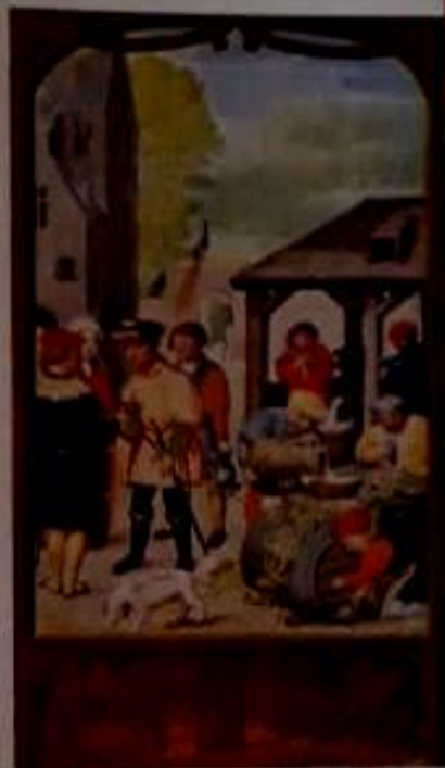
Mercaderes y trabajadores en una ciudad medieval del siglo XV.

El tránsito hacia nuevos modos de organización económica, social y política fue debilitando lentamente los fundamentos del orden feudal europeo. Sin embargo, las continuidades entre la época moderna y la medieval fueron muchas: en la sociedad rural persistieron las relaciones feudales; la mayor parte de la población siguió viviendo en el campo, ajena a las nuevas ideas, y la nobleza se mantuvo como el grupo más poderoso de la sociedad europea.