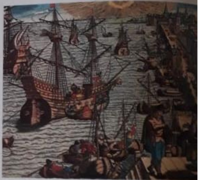
Durante el siglo XV, los puertos europeos sobre el Atlántico tuvieron una intensa actividad.

Por último, la curiosidad y el deseo de obtener fama y fortuna contribuyeron a que muchos hombres participaran en arriesgados y peligrosos viajes interoceánicos.