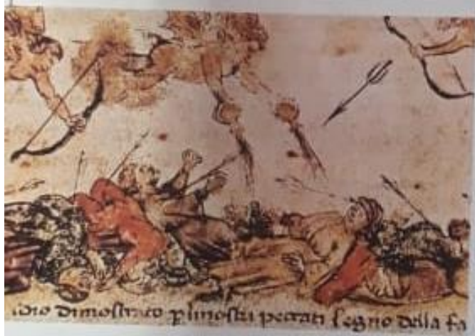
Una alegoría sobre la epidemia de peste negra que asoló Europa.

Al hambre y la peste se sumaron las guerras que los reyes y los señores feudales sostuvieron para ampliar sus territorios o establecer sus límites. La más larga y costosa fue la Guerra de los Cien Años , en la que se enfrentaron los reinos de Inglaterra y Francia. Las guerras trajeron más muertes, la destrucción de los cultivos, el aumento del gasto de los Estados y el incremento de los impuestos y las cargas feudales sobre los campesinos. El orden feudal entró en una etapa de profunda crisis.