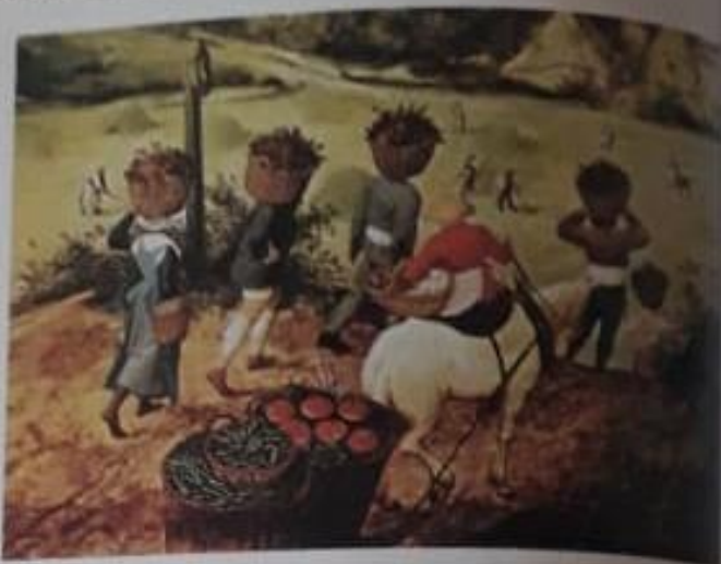
Campeñinos trabajando en la cosecha durante el verano, según una pintura de Abel Grimmer.

A partir del siglo XIII, los reyes comenzaron a recuperar la autoridad que habían perdido frente a los nobles y crearon nuevas instituciones de gobierno.