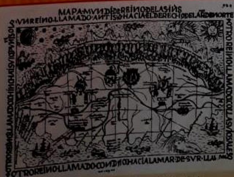
Representación del mundo hacia el 1600, realizada por el cartógrafo italo-guineano Guzmán Poma de Ayala.

Los historiadores de los siglos XVIII y XIX interpretaron las transformaciones ocurridas en Europa desde finales del siglo XV como una profunda ruptura del orden medieval. Por esta razón, en la periodización de la historia de Occidente que elaboraron, llamaron Edad Moderna al período comprendido entre el siglo XV y fines del XVIII. Los hechos tomados como referencia para marcar el comienzo de la Edad Moderna fueron la caída de Constantinopla en poder de los turcos, en 1453, y la llegada de los españoles a América, en 1492. Para marcar su finalización, consideraron el comienzo de la Revolución Francesa, en 1789.