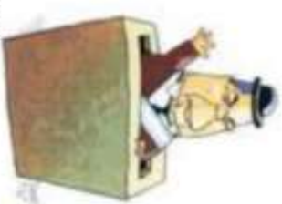
Por Daniel Puz

Puede ser que en otros países se dejen de lado algunas de estas normas (por ejemplo, se permiten reelecciones sucesivas o no hay verdaderas chances de que un segundo partido acceda al gobierno) pero se destacan los fines del gobierno, buscando que