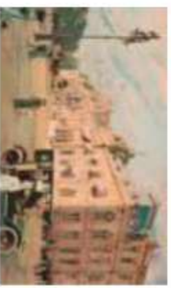
La casa rosada (1901), litografía de Angel Della Valle

De este modo, en la República Argentina tenemos un gobierno federal integrado por los tres poderes nacionales antes mencionados, y los gobiernos de provincia. Estos están compuestos por 23 provincias y la capital federal de la Nación, la ciudad de Buenos Aires (CABA), que desde 1994 es autónoma. Los gobernadores de provincia y el jefe de gobierno de la ciudad (CABA) deben hacer cumplir la Constitución en su territorio y son agentes naturales del gobierno federal (artículo 128 CN).